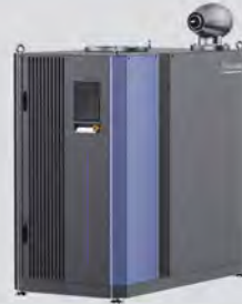
Smart Turbo Blower