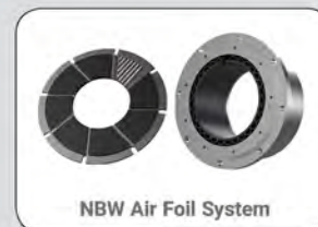
NBW Air Foil System