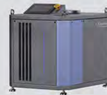
Micro Turbo Blower

سخت و ویژه دارای سیستم دوگانه خنک‌کننده هوا بدون استفاده از فن یا خنک‌کننده خارجی جهت کاهش ۱۰ درجه ای دمای پروانه نسبت به سایر برندها استفاده از بیرینگ یکپارچه ایرفویل بدون هیچ گونه خم و جوش با دوام بالا در دمای کاری بالا استفاده از سیستم حفاظت از نوسانات ورودی هوا جهت جلوگیری از توقف‌های اضطراری